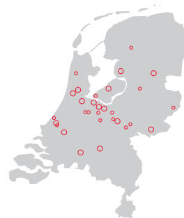
Locaties van Bergman Clinics in Nederland

Mocht u zich willen afmelden voor deze nieuwsbrief, dan kunt u dit doorgeven via huisarts@bergmanclinics.nl