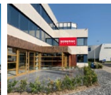
Capelle a/d IJssel