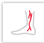
Huid &amp; Vaten