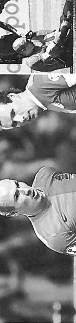
• Louis van Gaal

dat zijn goed recht en zullen we daar naar luisteren”, aldus Rob- ben. Tijdens de nabespreking zou de linksbuiten ook zijn zegje doen. „Ik vind dat we ook naar andere dingen moeten kijken. We had- den meer naar voren en sneller moeten spelen, konden lines overslaan en hadden eerder de zijkanten moeten zoeken.”